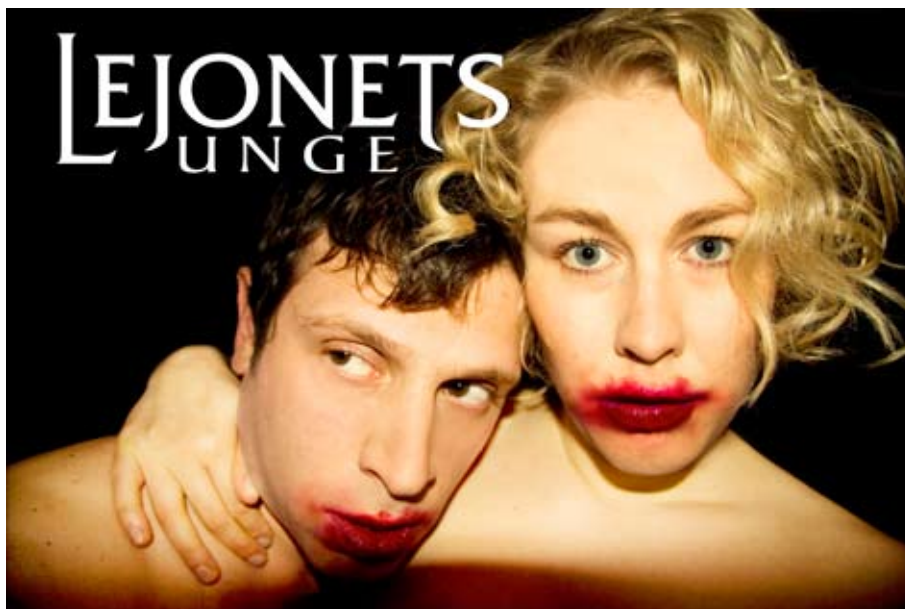
Affischbild Lejonets unge.